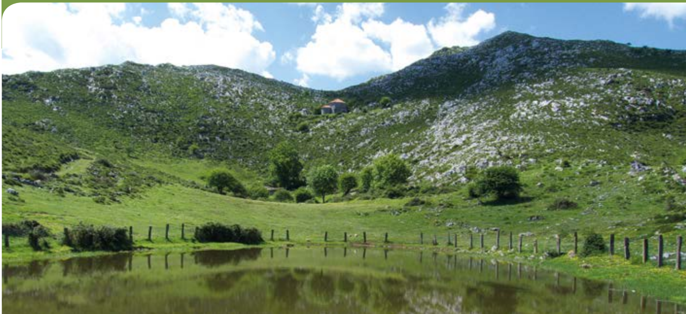
Ermitas del Monsacro.