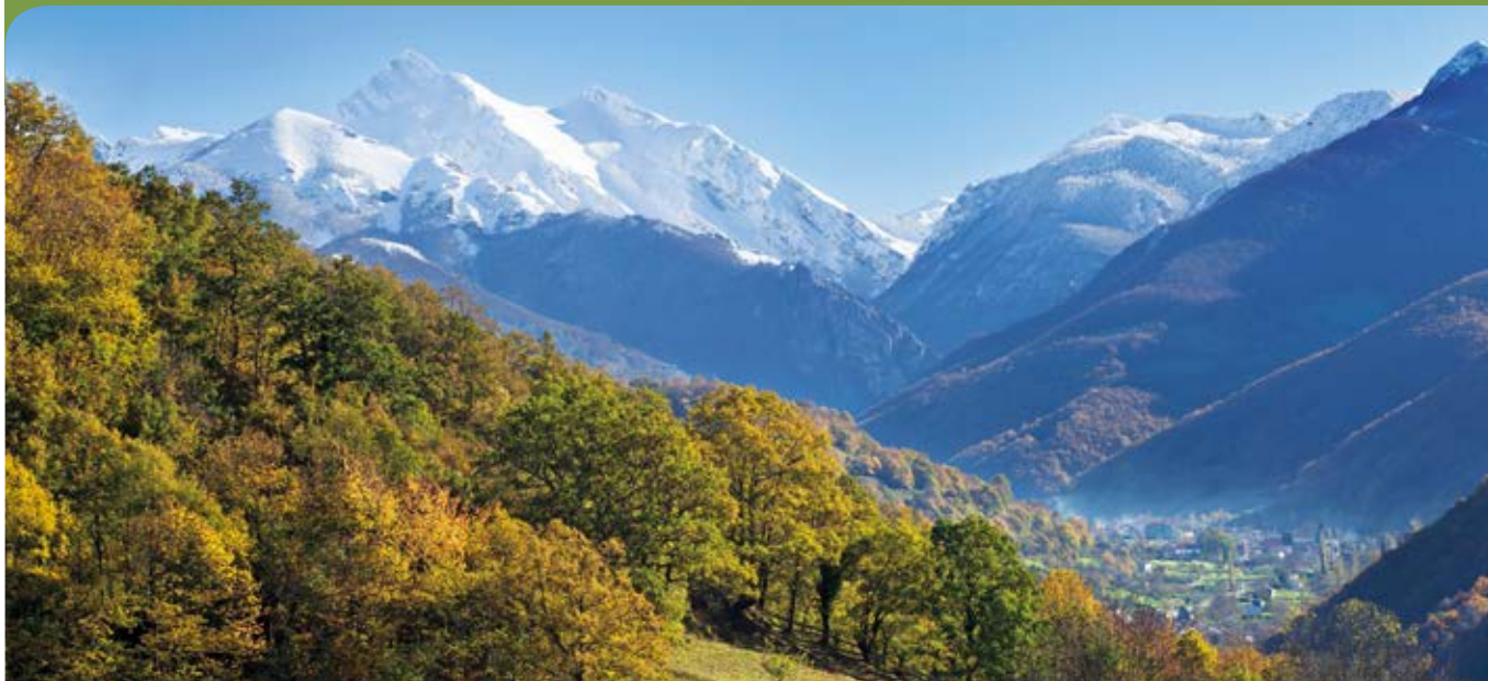
Vista general del valle desde Santibanes de la Fuente.