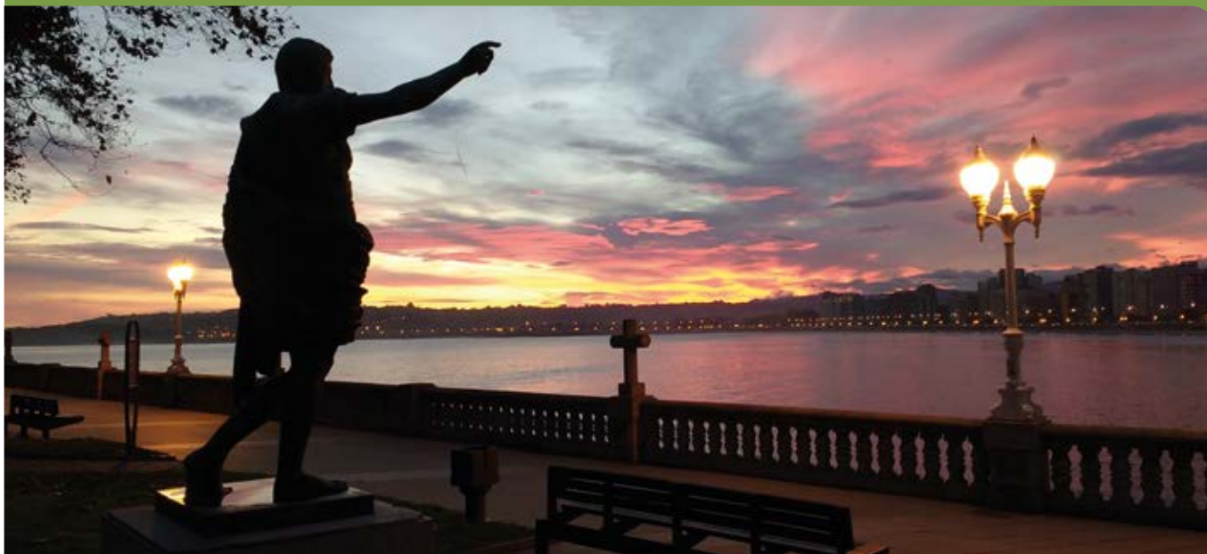
Playa de San Lorenzo desde Campo Valdés