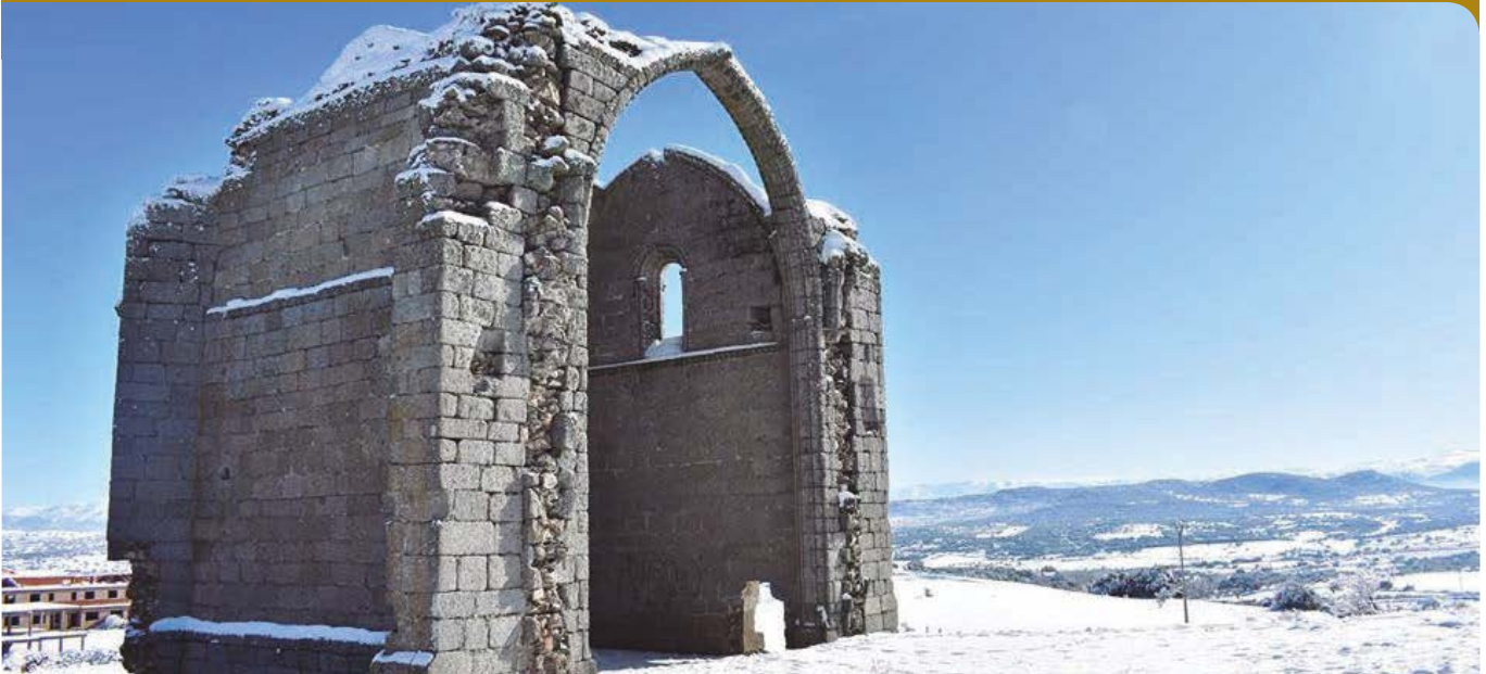
Torreón de Guijuelo