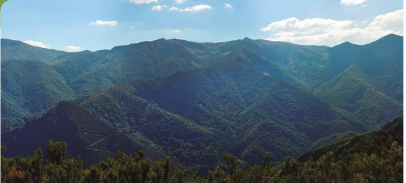
Bosque de Valgrande, en la Reserva de la Biosfera de Las Ubiñas-La Mesa.