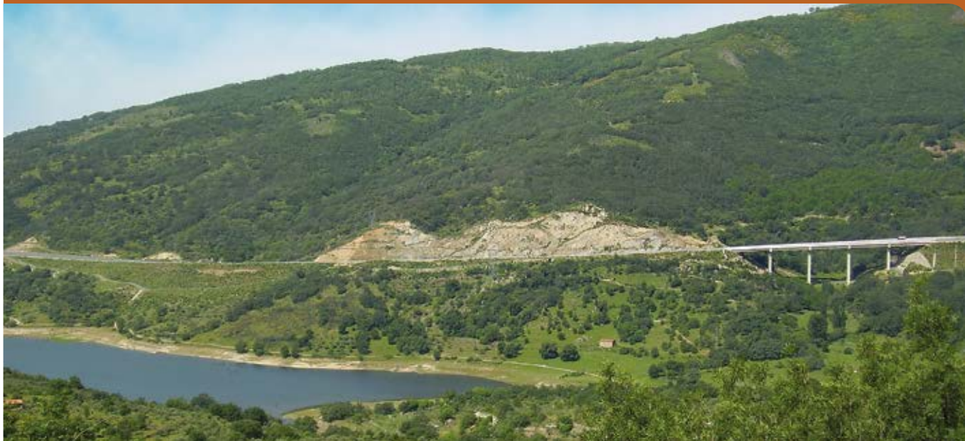
Ruta del Pantano de Baños y la Calamorcha desde el Mirador de la Estación.