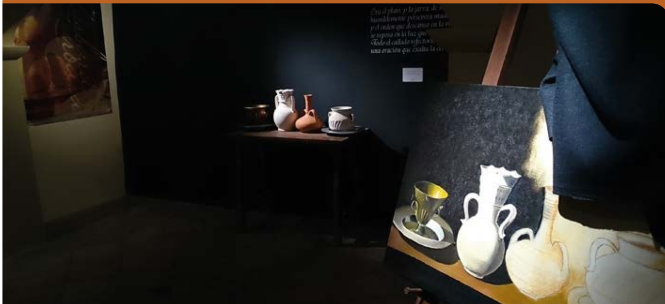
Casa-Museo Pintor Francisco de Zurbarán.