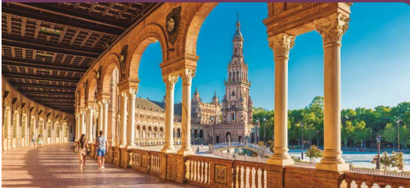
Plaza de España, Sevilla.