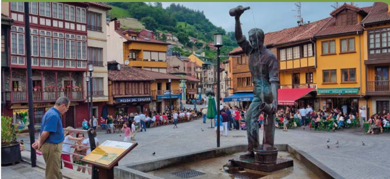
Plaza de Requejo.