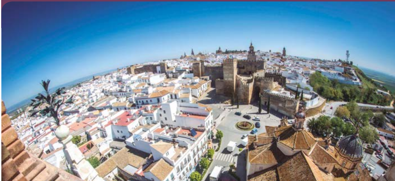
Vista general de Carmona.