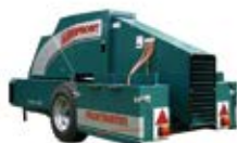
Frostbuster Protección máxima 8 hectáreas