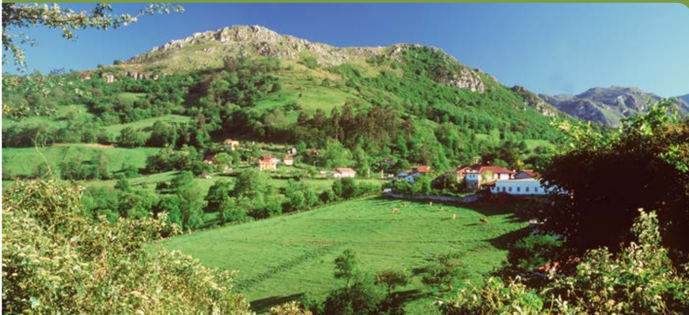
Pueblo de Sardín.