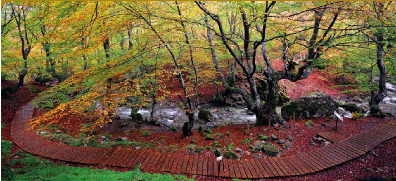
Faedo de Ciñera, premio al Bosque mejor cuidado (MAGRAMA) Autor: Miguel Aguilar.