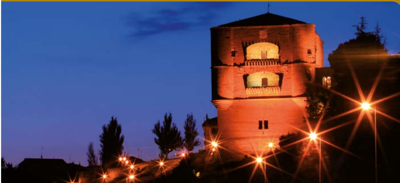
Castillo de la Mota. Torre del Caracol. Benavente.