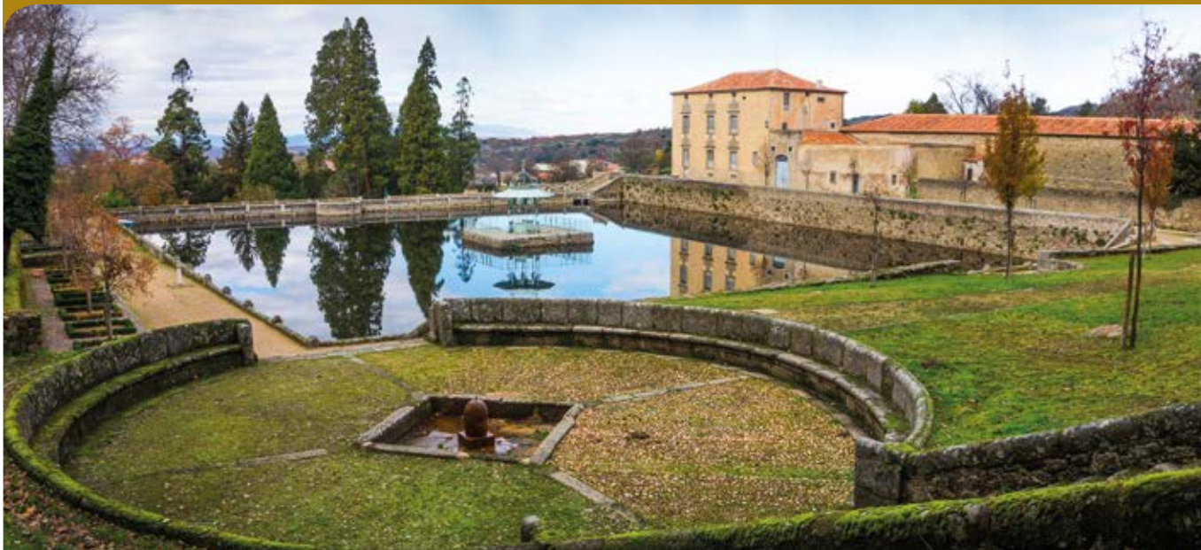
"El Bosque" BIC. Categoría Jardín Histórico.