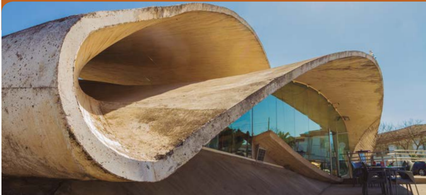
Estación de autobuses.