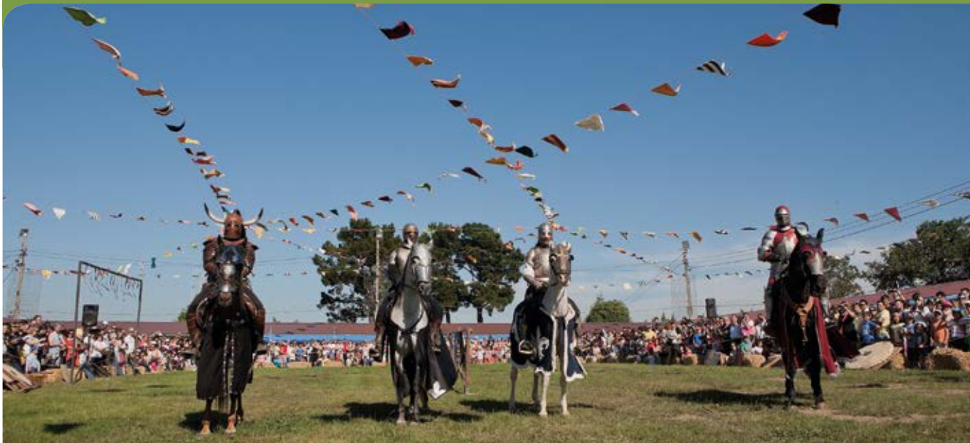
Fiesta de los Exconsuraoos, cita festiva por excelencia del verano en el municipio.