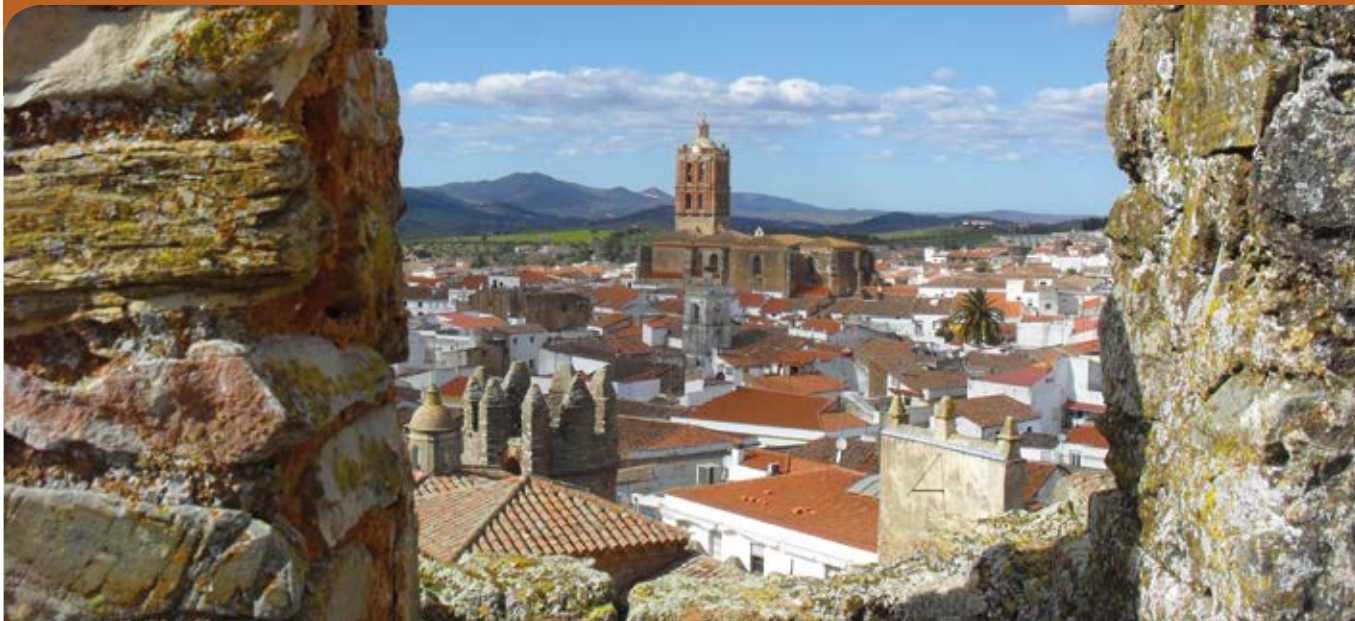
Panorámica desde las almenas de palacio.