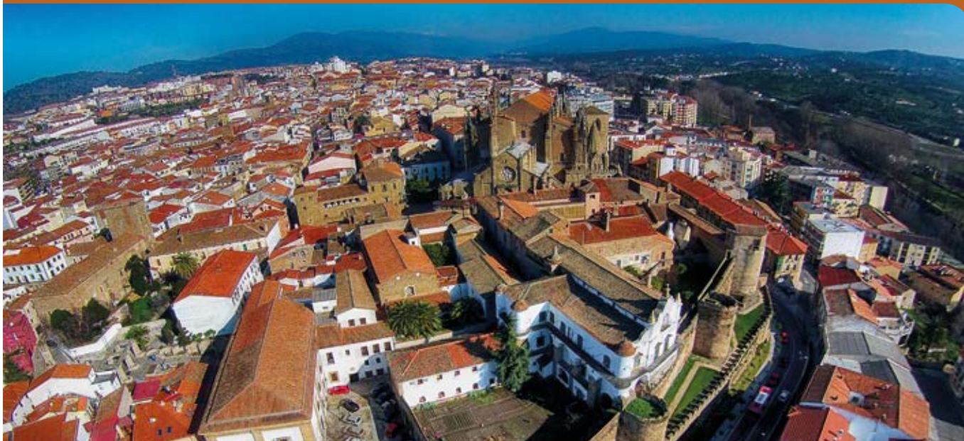
Vista aérea zona Palacio Episcopal.