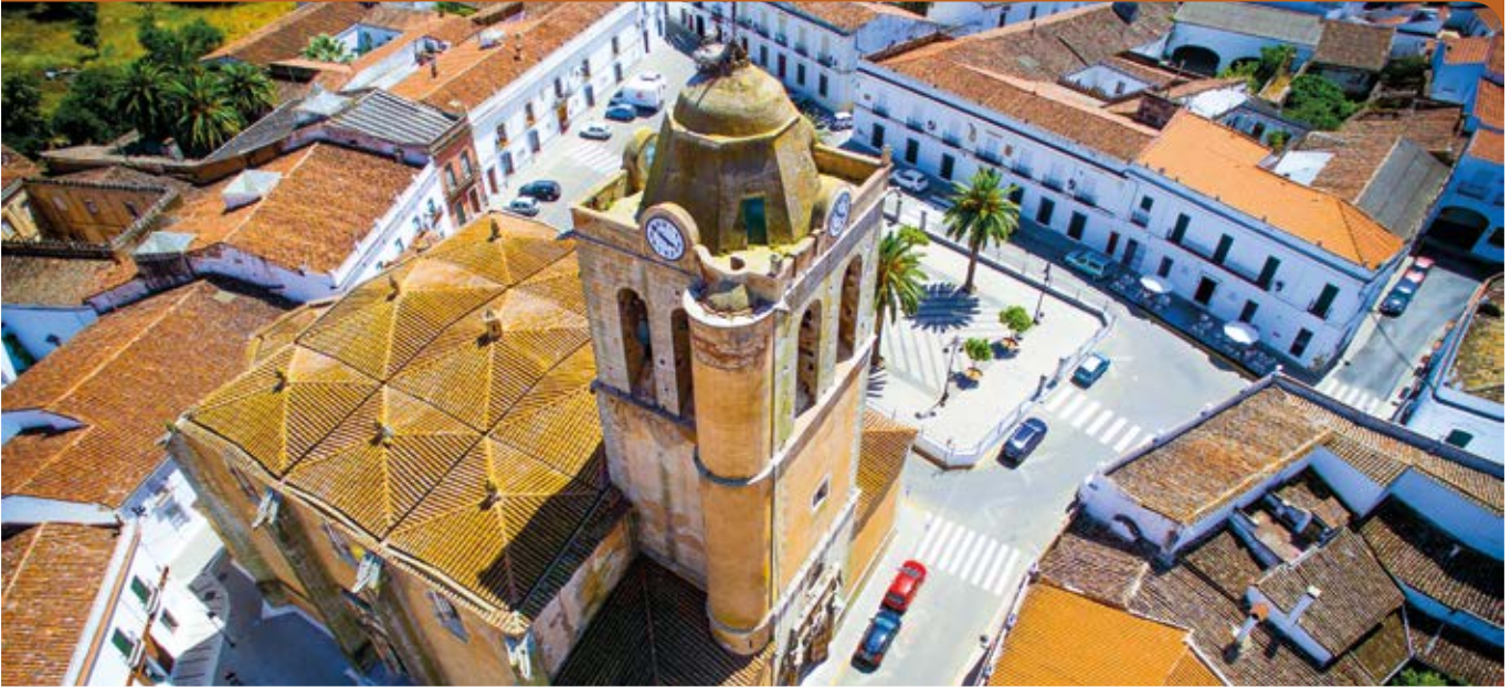
Plaza de España.