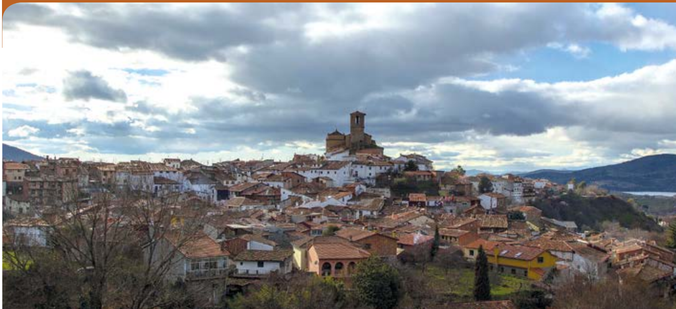
Vista general desde el mirador del Puente de Hierro.