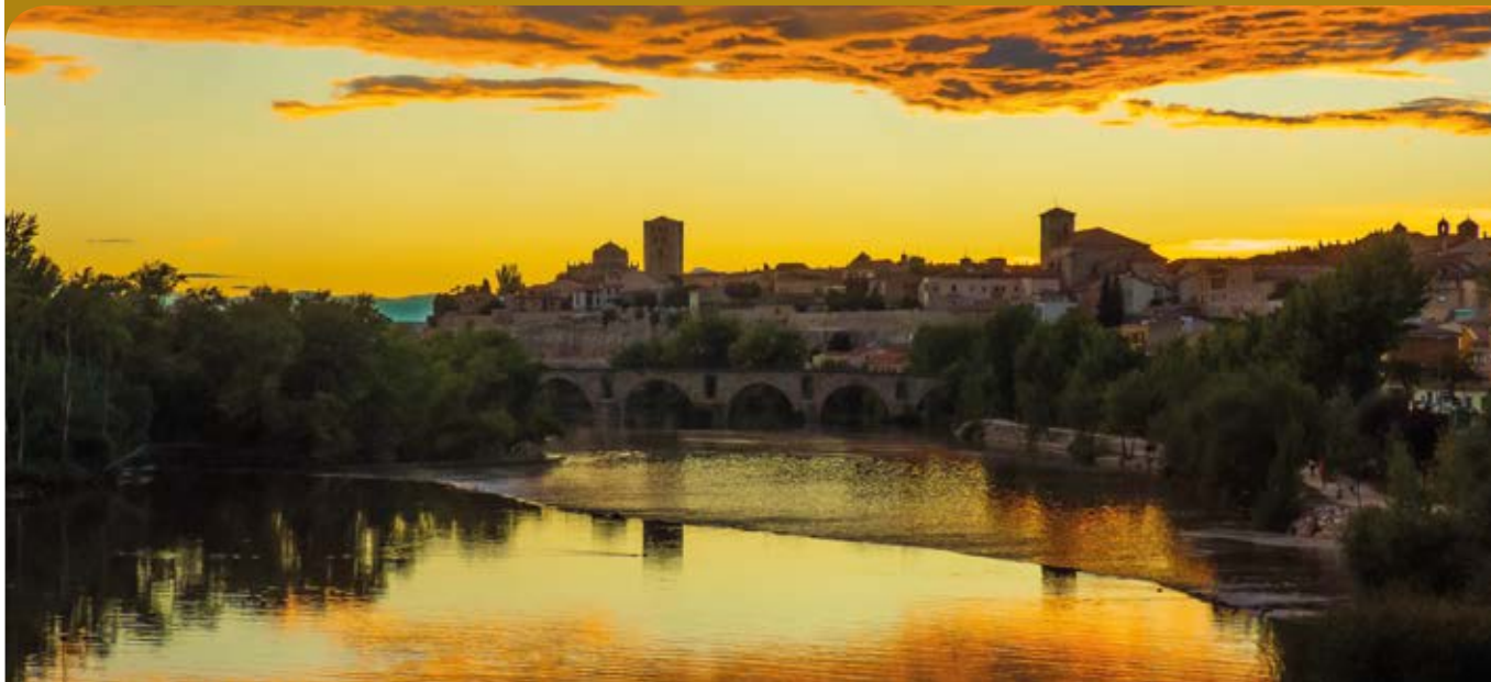
Panorámica de la ciudad de Zamora.