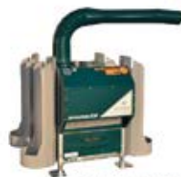
FrostGuard Protección máxima 1 hectárea