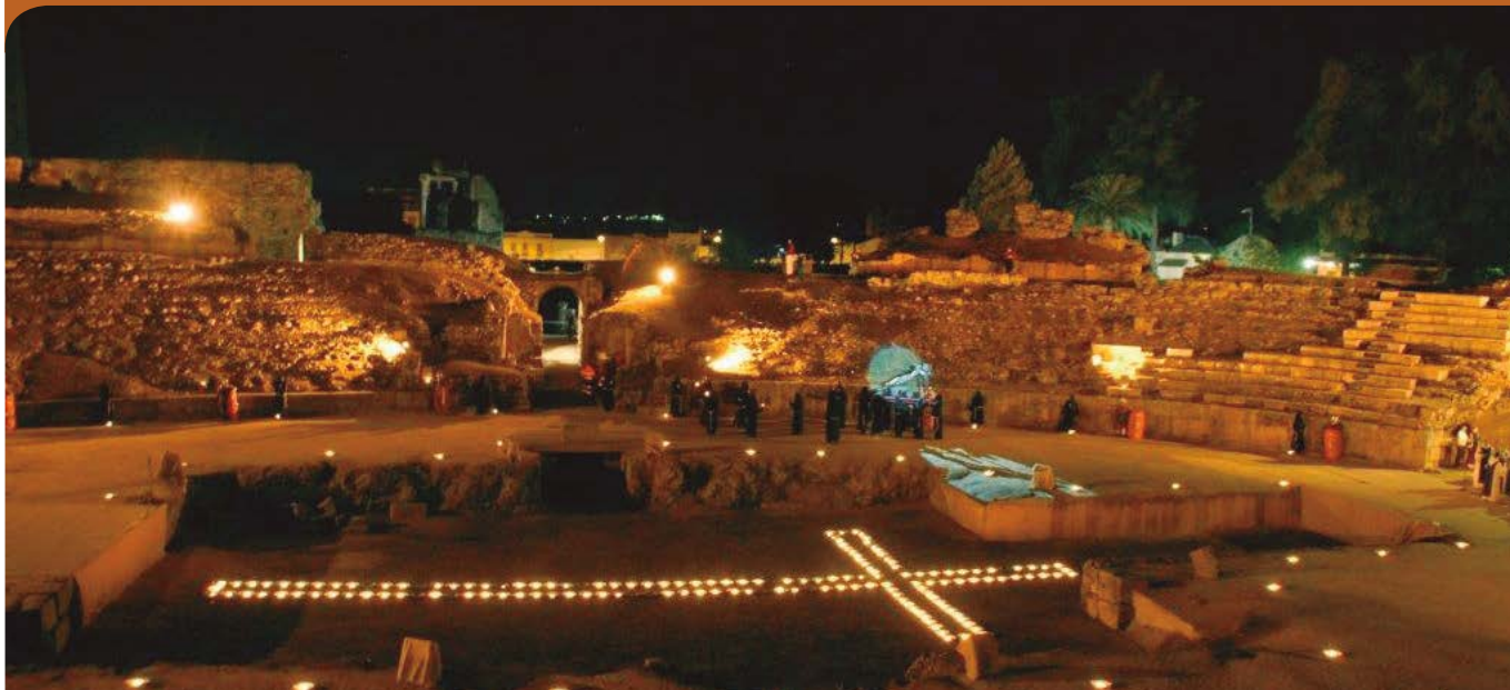
Semana Santa de Mérida. Fiesta de Interés Turístico Nacional (Vía Crucis en Anfiteatro romano).