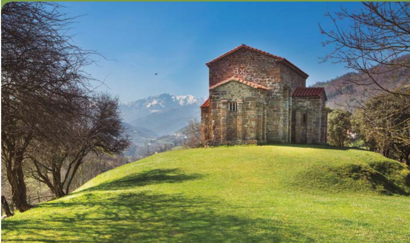
Santa Cristina de Lena, Concejo de Lena.