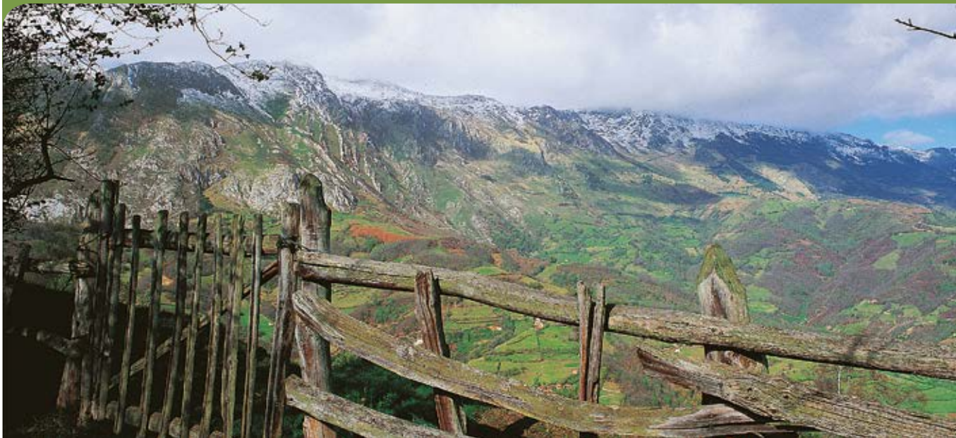
Vista de la Sierra del Aramo.