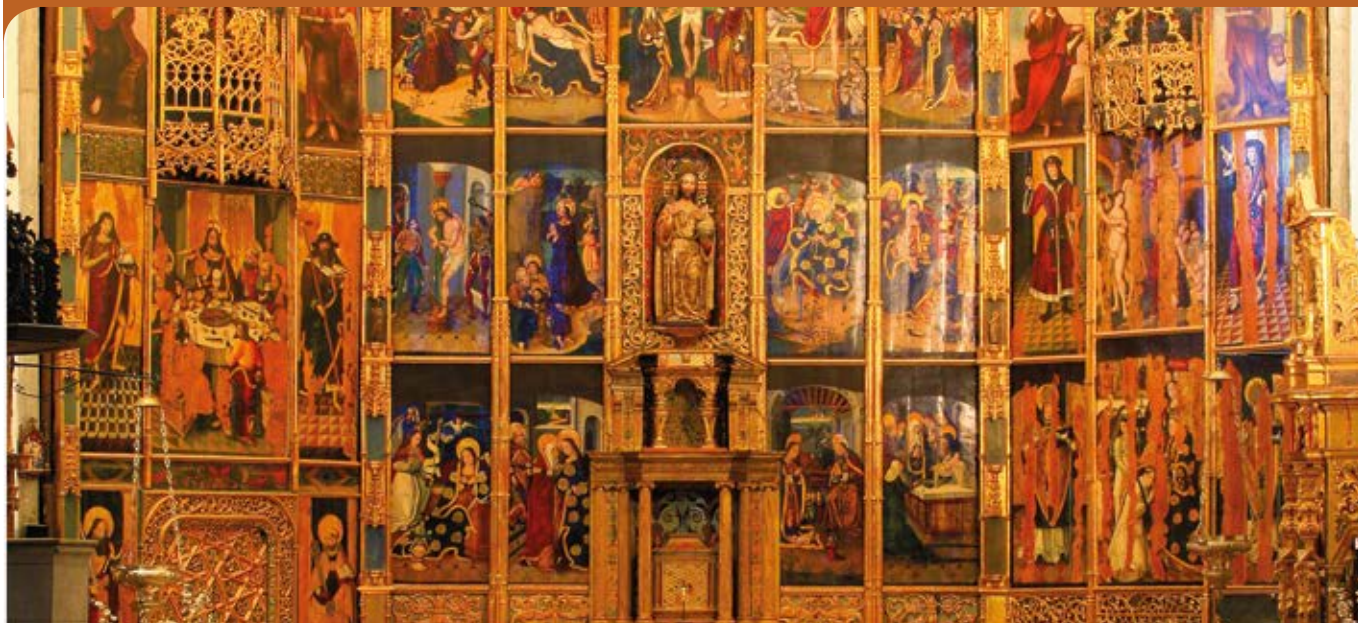
Retablo Gótico Mudéjar (S.XV- XVI).